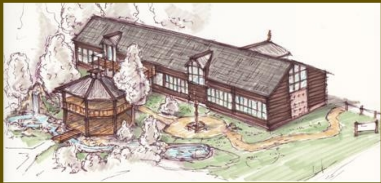
Concept Forest Returns, Beukenrode